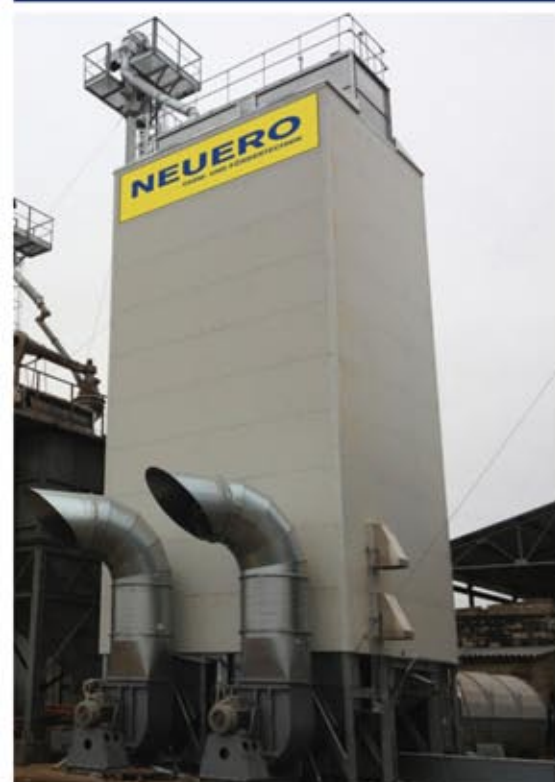
Шахтная сушилка NDT 9-2, 48,7 т/ч по пшенице с 19 на 15%, Северная Осетия

Компьютер для управления процессом сушки