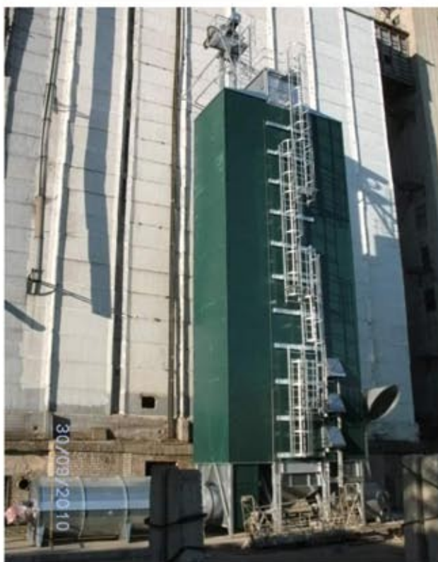
Шахтная сушилка NDT 11-1, 30 т/ч по пшенице с 19 на 15%, Читинская область